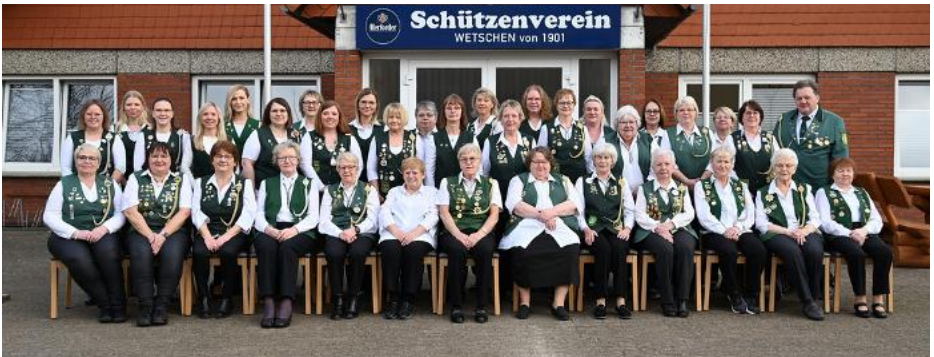
Gruppenfoto der Damenschießgruppe zum Jubiläum

Weiter ging es im Jahr 2025 mit dem 50-jährigen Jubiläum der Damenschießgruppe. Im Rahmen eines Vergleichsschießen mit befreundeten Vereinen wurde eine gesellige Jubiläumsfeier im Schützenhaus abgehalten.