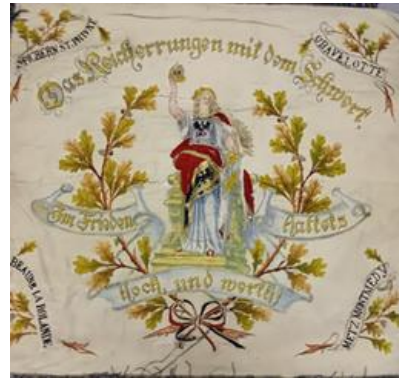
Vorder- und Rückseite der Fahne des Kriegervereins Wetschen von 1897