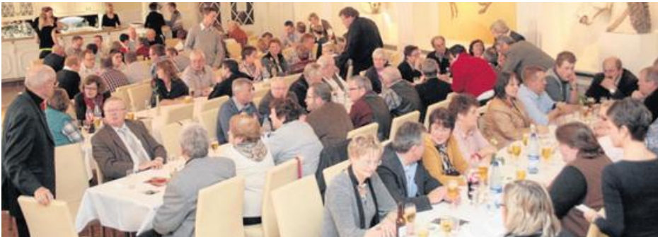
Der 111. Geburtstag wurde im Rahmen eines Dorfgemeinschaftsfestes gefeiert.

Im Jahr 2012 feierte der Schützenverein am 11.11. um 11.11 Uhr sein 111-jähriges Bestehen im Gasthaus Recker. Es sollte an diesem Tag nicht nur an die Vereinsgründung vor 111 Jahren gedacht werden, sondern auch ein Schlusspunkt hinter sehr ereignisreiche Jahre des Schützenvereins mit der Renovierung des Schützenhauses, der Ausrichtung des Kreiskönigstreffens sowie der Überdachung der KK-Stände gesetzt werden.