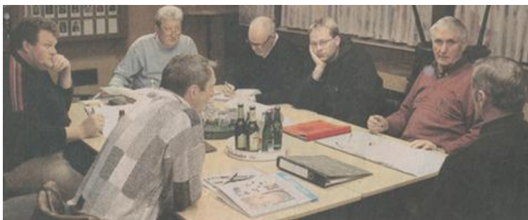
Das Planungsteam im Rahmen einer Arbeitssitzung

Auf Grundlage dieses eindeutigen Beschlusses konnten die weiteren Planungen zielgerichtet aufgenommen und Schritt für Schritt umgesetzt werden, es entwickelte sich zu einem der bedeutendsten Projekte der Vereinsgeschichte. Mit großem Engagement, vielen ehrenamtlichen Arbeitsstunden und der Unterstützung zahlreicher Förderer wurde das Schützenhaus schließlich umfassend ausgebaut und modernisiert.